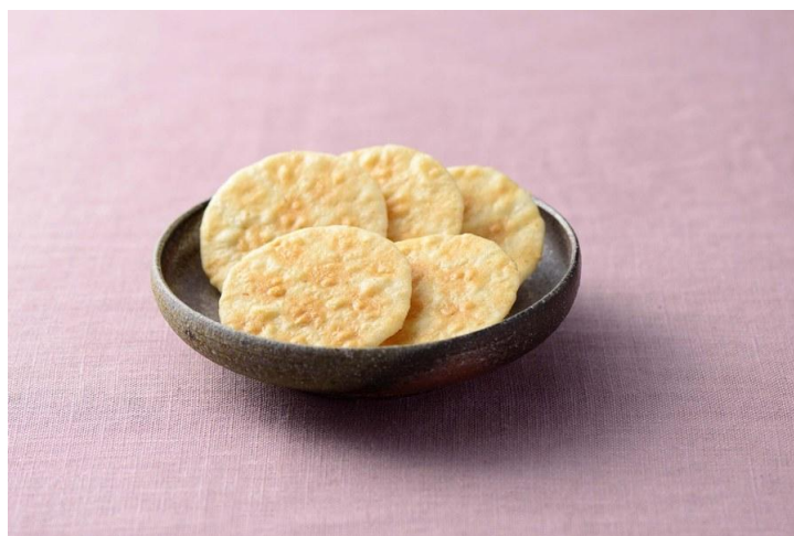
しろえびせんべい (商品イメージ)