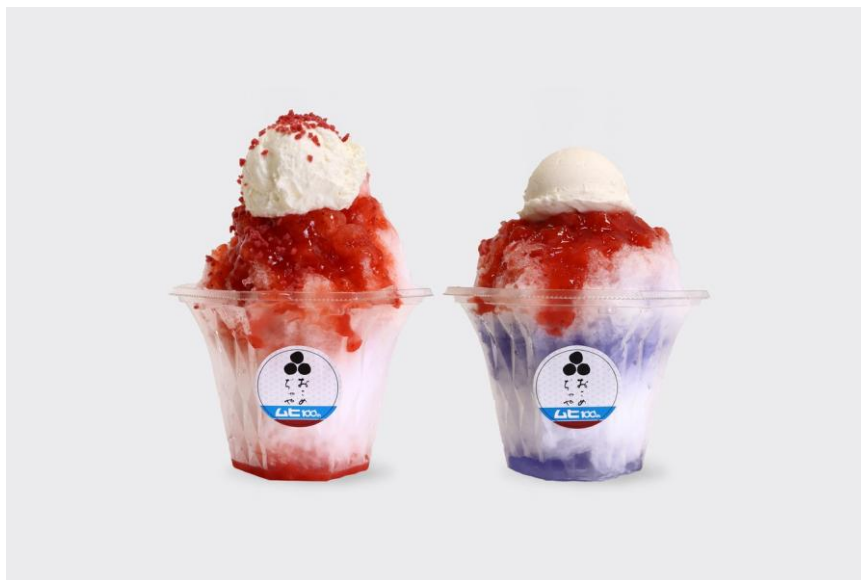
限定かき氷 2種 (会場限定・予定)

った「いちごかき氷」。白い氷とレアチーズムースを合わせれば、ムヒを象徴する白・赤・青がそろって、夏にうれしい会場限定スイーツです。