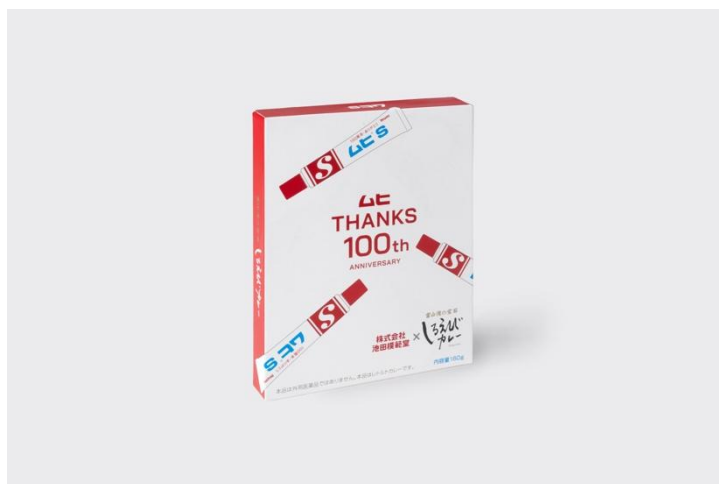
ムヒ用オリジナルレシピ レトルトしろえびカレー

辛さはおさえめで白えびの旨みがやさしく香る一品に仕上げました。「ムヒ THANKS 100th」をあしらった記念パッケージで、家族や友人と「なんでムヒとカレーなの？」と会話を弾ませながら味わってほしい逸品です。