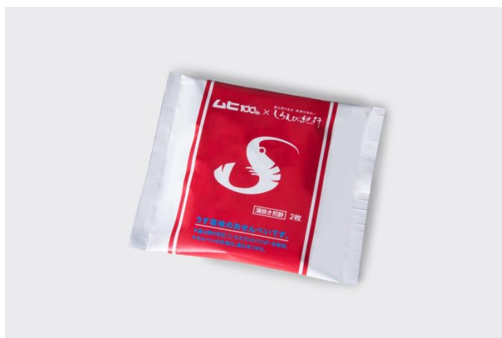
しろえび紀行 ムヒコラボパッケージ 2 枚入り

る配色に仕上げました。デザインの見どころは、商品名の「S」の文字を海老のイラストで表現した遊び心。海老のフォルムを生かしながら美しい「S」へ落とし込むバランスには、試行錯誤を重ねました。同じく富山を拠点に全国で親しまれてきた「ムヒ」との、お菓子メーカーと医薬品メーカーだからこそ実現したこの夏限定のコラボです。なお、本商品は販売を行わず、サンプリングでの配布を予定しています。