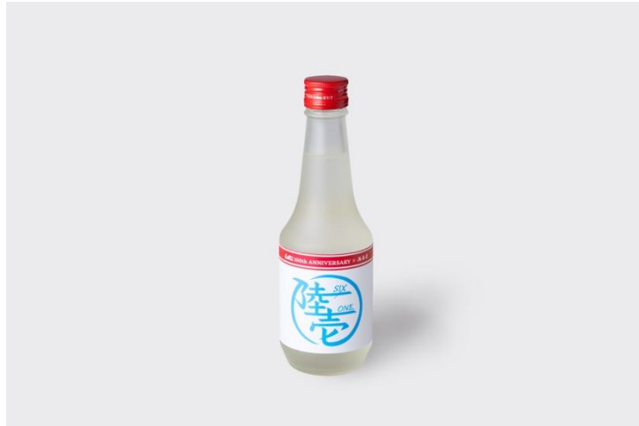
日本酒 満寿泉「陸壹」ラベル 270mL