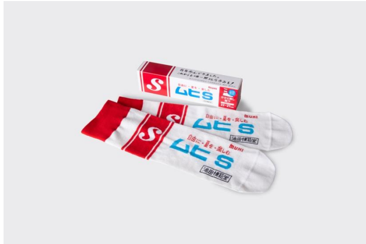
ムヒ S デザイン靴下 (ケース付き)