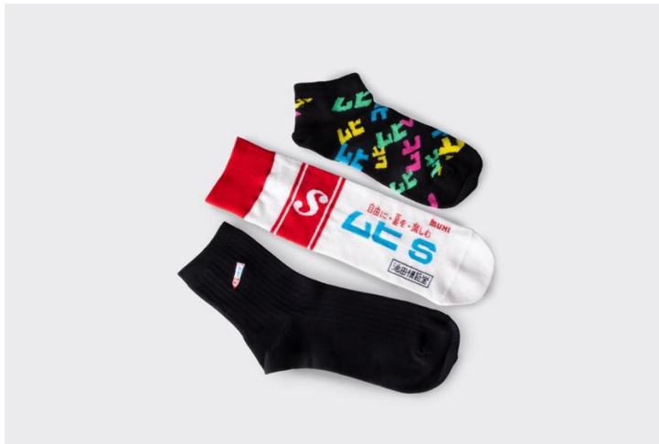
ムヒデザイン靴下別カラー