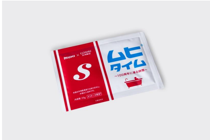
入浴料「ムヒタイム」1回分