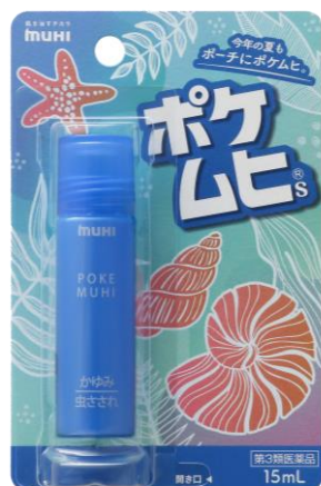
レギュラーバージョン

「ポケムヒ S」 パッケージ と ボトルデザイン フルリニューアル 1950 年誕生の世界的に有名な犬のキャラクター「スヌーピー」採用 ～ 2024 年 4 月 3 日 全国発売 ～