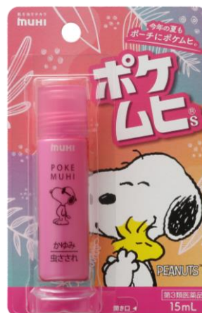
スヌーピーバージョン

PEANUTS™ © 2024 Peanuts Worldwide LLC www.snoopy.co.jp